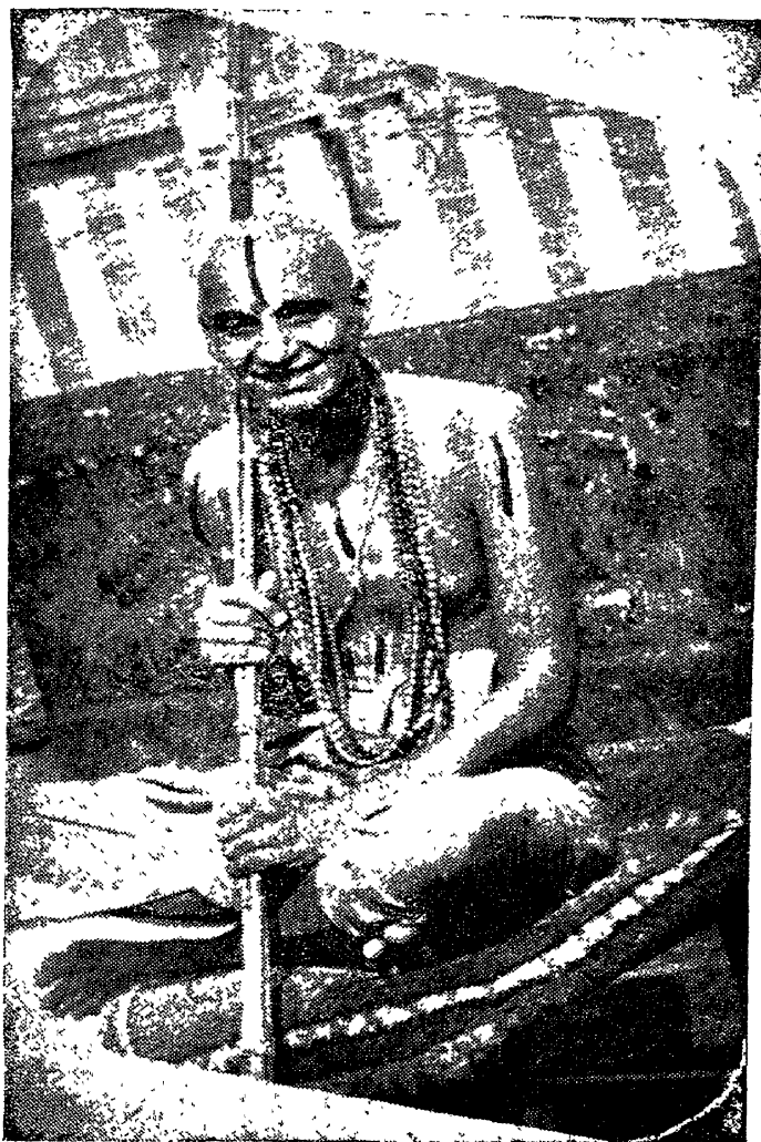
श्रीमत् त्रिदण्डि श्रीमन्नारायण जिय्यर् स्वामिनः